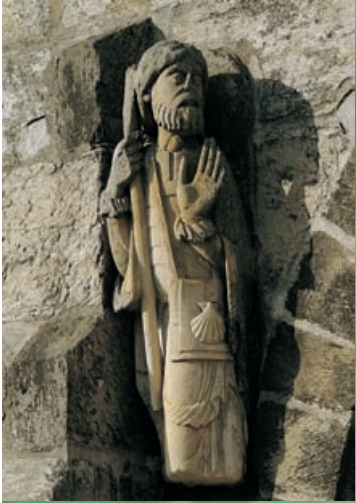
Santiago Apostol. Iglesia de Sta. Marta de Tera