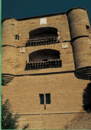
Torre del Caracol. Parador de Benavente